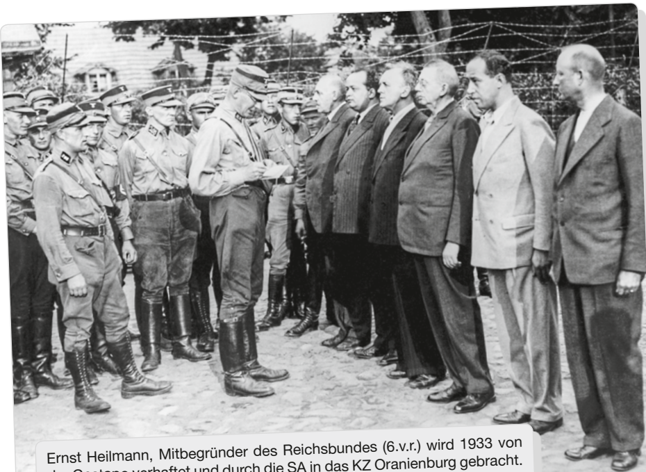
Ernst Heilmann, Mitbegründer des Reichsbundes (6.v.r.) wird 1933 von der Gestapo verhaftet und durch die SA in das KZ Oranienburg gebracht.