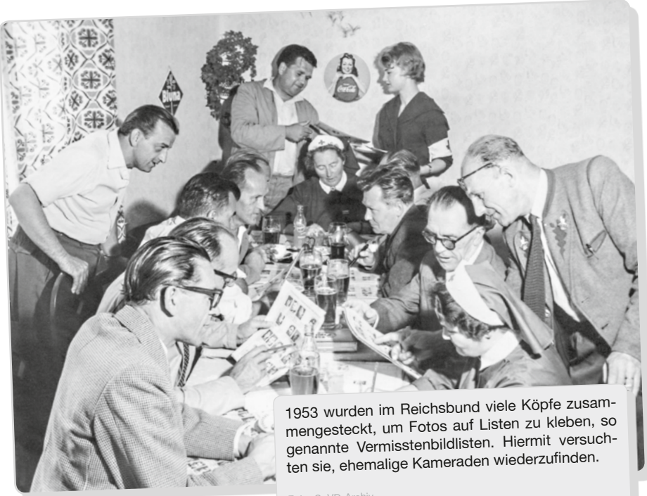
1953 wurden im Reichsbund viele Köpfe zusammengesteckt, um Fotos auf Listen zu kleben, so genannte Vermisstenbildlisten. Hiermit versuchten sie, ehemalige Kameraden wiederzufinden.