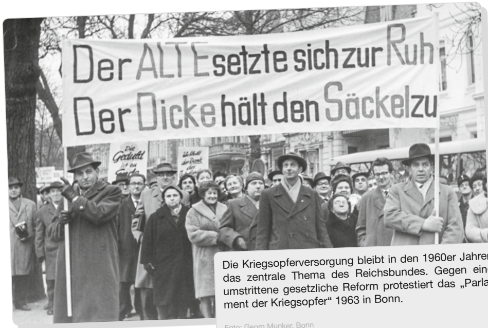
Die Kriegsoferversorgung bleibt in den 1960er Jahren das zentrale Thema des Reichsbundes. Gegen eine umstrittene gesetzliche Reform protestiert das „Parlament der Kriegsofener“ 1963 in Bonn.